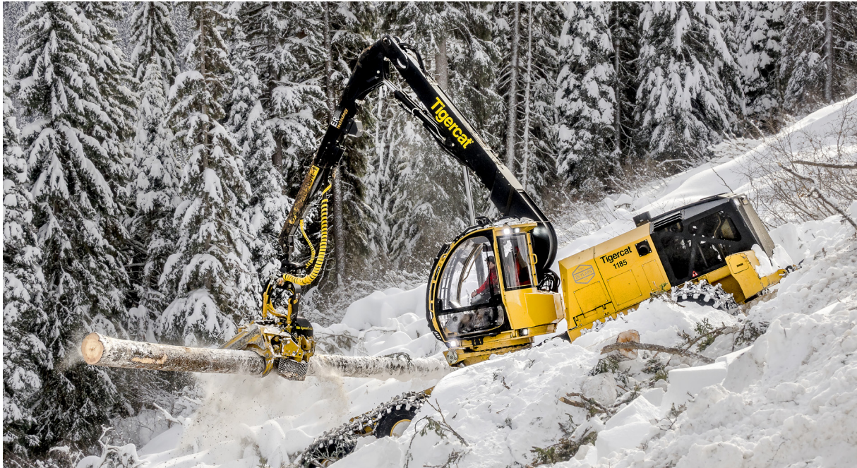
Harvester 1185

Zdaj beležijo večjo doslednost pri vsakodnevni proizvodnji delov, nova pa je tudi možnost selitve operaterjev med obdelovalnimi stroji, ko to zahteva proizvodnja. Tveganje človeških napak so praktično izkoreninili, z odpravo ročnih posegov pa se je izboljšala tudi varnost na delovnem mestu.