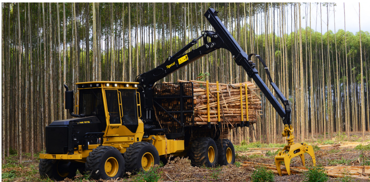
Zgibni polprikoličar 1075

»Med procesom odločanja o nakupu merilnih sistemov za stroje smo se pogovarjali z več podjetji. Na koncu smo se odločili samo za eno podjetje, s katerim smo se dobro sporazumeli in ki se idealno ujema z našo tehnično kulturo. To je bil Renishaw. Zagotavljajo nam dobro tehnično podporo, imajo dobro usposobljene terenske tehnike, njihovo tehniko pa lahko opišem le kot vrhunsko.«